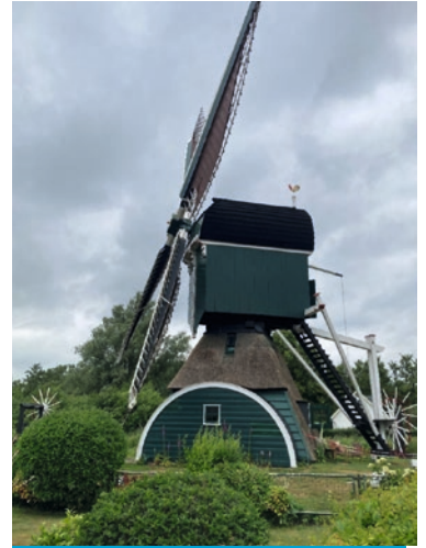
Molen De Trouwe Wachter, Tienhoven

Hoop brengt mensen in beweging. Niet luidruchtig of dramatisch, maar gestaag. Zoals een wolk die langzaam samenpakt en uiteindelijk regen brengt. Hoop is als iets dat groeit in gemeenschap — je leent soms even de hoop van een ander als die van jezelf op een laag pitje staat.