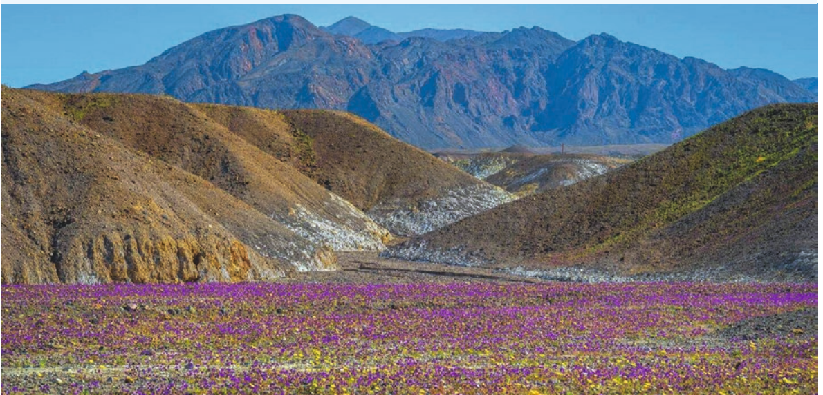
Bloeiende woestijn: gemiddeld eens in de 10 jaar een teken van hoop!

Sta op Sion en juich Want de Here heeft u verlost Want de lamme zal springen als een hert En de stomme zal jubelen en juichen